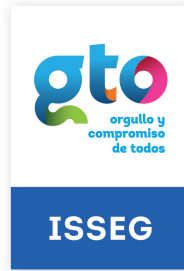
IMAGEN.- Los empleados del Instituto portamos y cuidamos la imagen oficial del ISSEG, y así se fortalece el posicionamiento y fácil identificación con los usuarios y clientes, tanto en el área Institucional como en la Comercial.